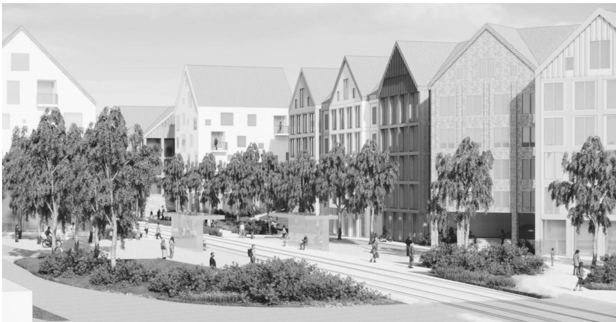
Illustrasjon av mulig bebyggelse langs det nye bybanestoppet. 3RW arkitekter.

Hensikten med planarbeidet er å transformere Langarinden fra et område med industri og store næringsbygg til et grønt boligområde ispedd noe næring/handel – en utvikling i tråd med overordnede planer, retningslinjer og strategier. Den planlagte bybanetraséen og bybanestoppet Langarinden er utgangspunktet for planarbeidet. Områdets strategiske lokalisering tett på det planlagte bybanestoppet og nærheten til grøntområdet rundt Liavatnet danner et bakteppe for en bærekraftig byutvikling gjennom en kompakt og attraktiv bystruktur. Fortettingen og transformasjonen skal gjøres med kvalitet, slik at Langarinden blir et godt sted å bo, leve, arbeide og besøke. Eksisterende stedskvaliteter skal utvikles og nye skal tilføres området. Det er en ambisjon at reguleringsplanen skal bidra til å forbedre de fysiske så vel som sosiale forholdene, og bidra med trygge og sosiale møteplasser med gode koblinger til området sine grønne og blå kvaliteter.