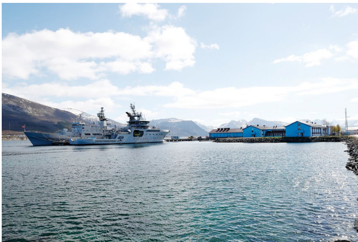
Figur 1 Kystvaktskipene KV Nordkapp og KV Harstad til kai ved Kystvaktens base på Sortland.

Planinitiativ er utarbeidet i henhold til § 1 i Forskrift om behandling av private forslag til detaljregulering etter pbl. av 3RW arkitekter, på vegne av forslagsstiller Forsvarsbygg