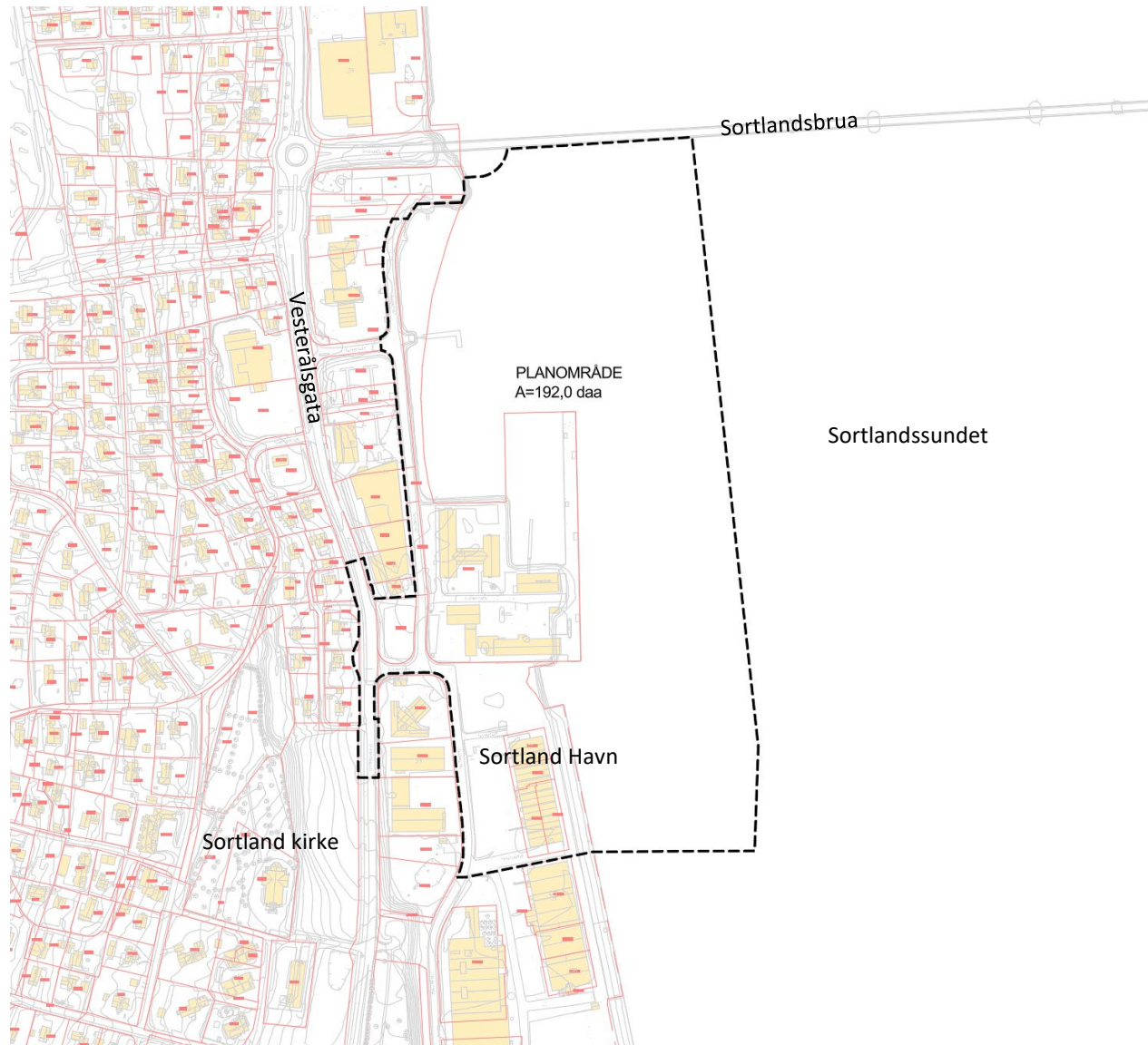
Figur 2: Varslingsgrense

Planområdet ligger sentralt, like nord for Sortland sentrum. Mellom dagens kystvaktstasjon og sentrum ligger det et havneområde. Forsvarsbygg og Sortland Havn er i en forhandlingsprosess om en avtale om å leie eller erverve deler av havneområdet for å kunne utvide eksisterende kaiarealer for å sikre kapasitet til nye fartøyer.